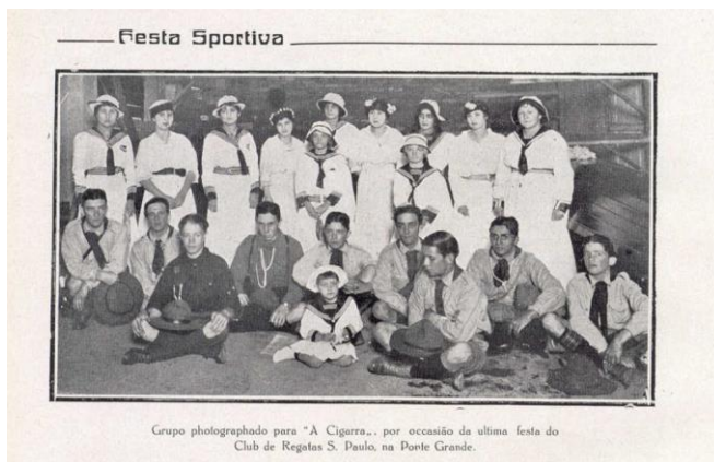
Foto publicada no “O Estado de São Paulo” de 11 de agosto de 1915”

A mesma foto publicada na revista “A Cigarra” de 24 de agosto de 1915