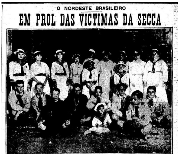
Sociedade da Associação Athletica de S. Paulo e Escoteiros, que, na brilhante festa ha dias realisada na Ponte Grande, fizeram uma collecta, cujo resultado ja publicamos, em favor dos famintos do Nordeste.