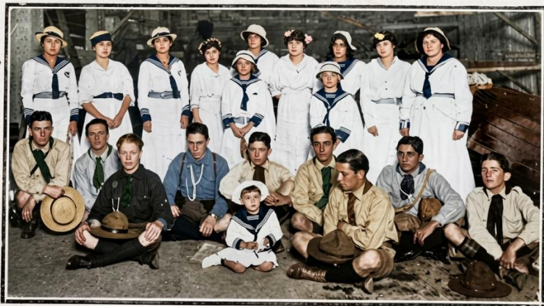
Grupo photographado para "A Cigarra...", por ocasião da última festa do Club de Regatas S. Paulo, na Ponte Grande.