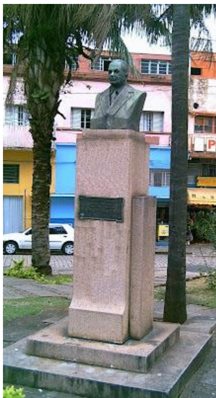
Monumento em homenagem a Herma de Carvalho Braga na av. Andrade Neves, em Campinas