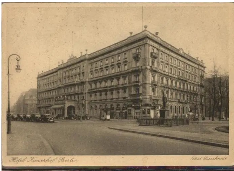
Hotel Kaiserhof – Berlim – início do século XX

À noite, foi oferecido aos convidados um jantar no salão do grande hotel Kaiserhof, ao som de uma “orquestra de professores”.