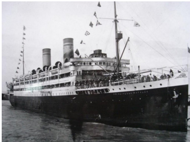
O Princesa Mafalda

Segundo uma reportagem do Jornal do Commercio, do Rio de Janeiro de 28 de abril de 1910, os membros da comissão receberiam de vencimentos: