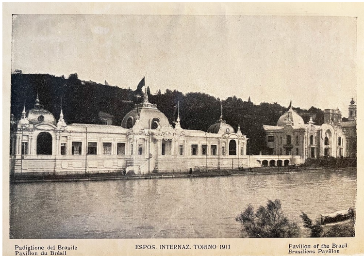
Padiglione del Brasile Pavillon du Brésil