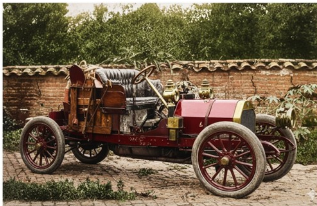
Motobloc de Antonio Prado Jr – 1908 Imagem colorida e modificada por IA