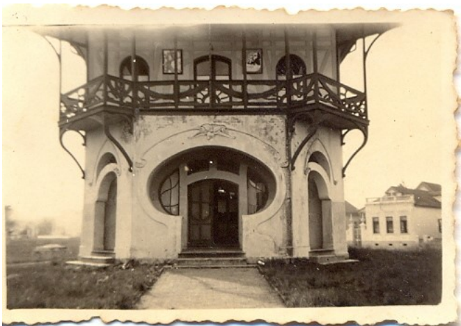
Prédio do Belvedere – Curitiba – Sede da Federação

A sede da Federação dos Escoteiros do Paraná e Santa Catarina ficava no prédio do Belvedere, no alto do São Francisco, onde havia funcionado a estação de rádio da PRB2.