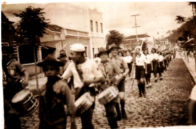
Excursão a Antonina – Desfile – 1943

Em 25 de agosto de 1943, a Associação de Escoteiros Escolares passa a denominar-se Associação Escoteira General Rondon. O lenço dos escolares, que era amarelo, passou a ser marrom com um friso branco.