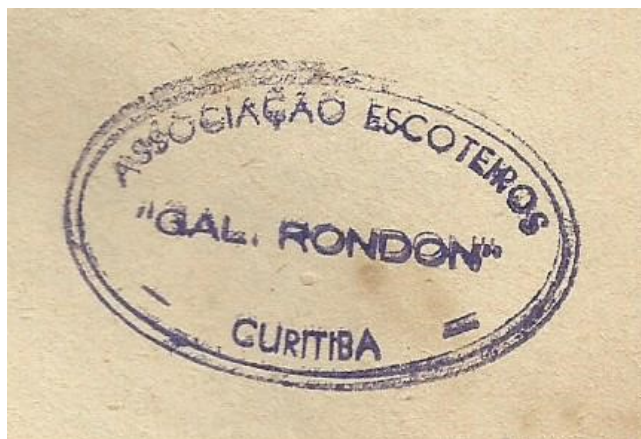
Carimbo da Associação General Rondon

Em 25 de agosto de 1943, a Associação de Escoteiros Escolares passa a denominar-se Associação Escoteira General Rondon. O lenço dos escolares, que era amarelo, passou a ser marrom com um friso branco.