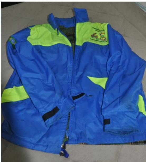
Foto da jaqueta usada pela delegação brasileira ao 19º Jamboree Mundial – Chile - 1999