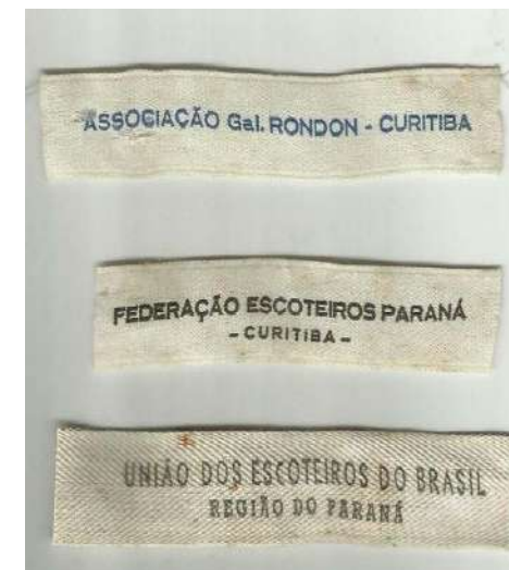
Carimbo da antiga Federação dos Escoteiros do Paraná