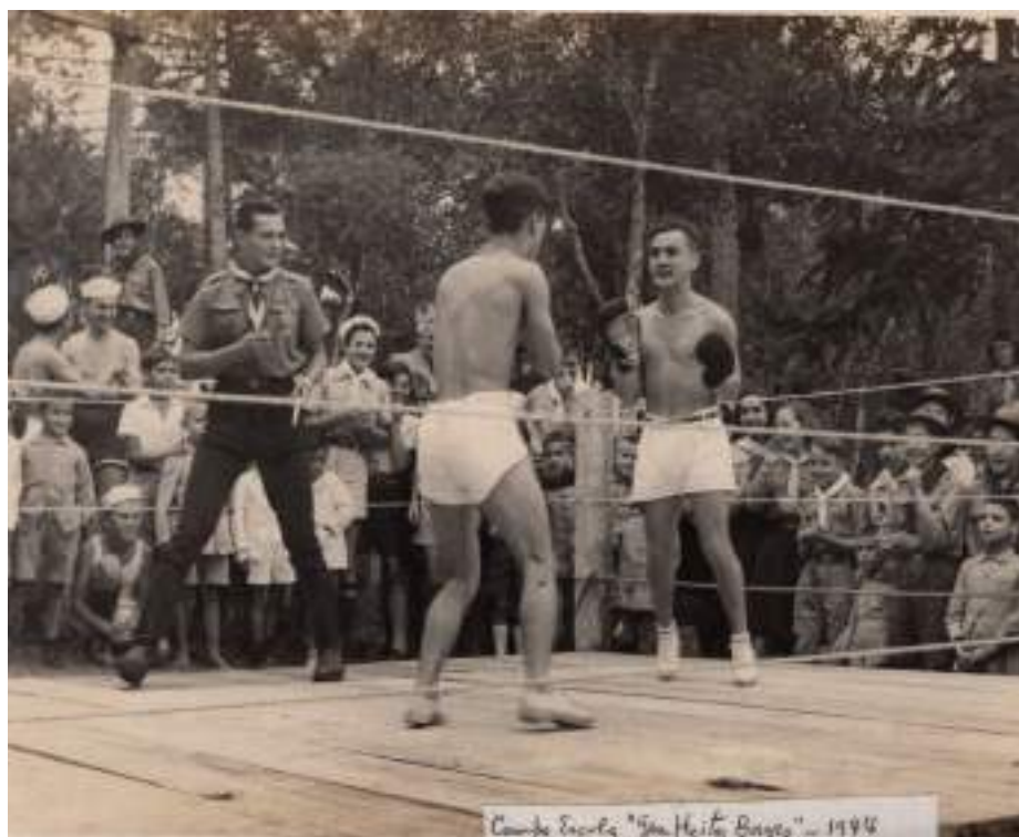
Foto de Luta de Box Por ocasião da Inauguração do Campo Escola General Heitor Borges em Curitiba - Acervo de Ernani Costa Straube