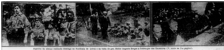
Aspectos do almoço realizado domingo na Academia de Letras e da visita do gen. Heitor Augusto Borges à Federação dos Escoteiros (V. sexto na 3.ª página).

Na mesma edição do jornal “Última Hora”, de 26 de setembro de 1944, já mencionada, também são publicadas três fotos relativas ao evento.