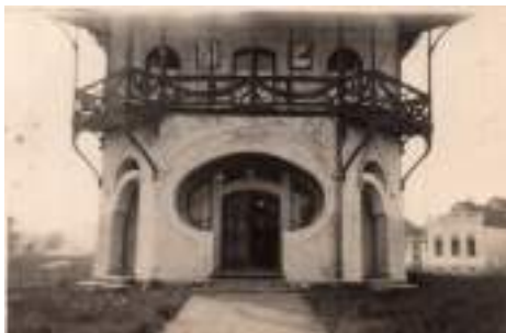
Foto do Belvedere, no alto do São Francisco, que era a sede da Federação dos Escoteiros do Paraná e Santa Catarina.